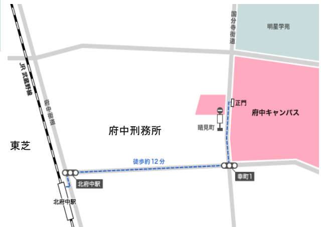
JR武蔵野線「北府中駅」から府中キャンパスへ